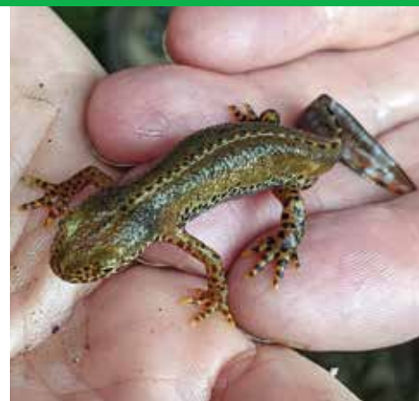
Planinski pupek (Ichthyosaura alpestris) (foto: Katja Pobiljšaj)

Svet Evropske unije je 17. junija 2024 potrdil Uredbo o obnovi narave, ki skupaj z Evropskimi podnebnimi pravili postavlja temelj za prihodnost, v kateri bo družba lahko preživela. Blaženje podnebnih sprememb je tesno povezano z zaščito biotske raznovrstnosti, saj sta varovanje ekosistemov in boj proti podnebnim spremembam neločljivo prepletena. Mokrišča, močvirja, travnate površine, morski ter drugi habitati igrajo odločilno vlogo pri oblikovanju podnebja. Žal je kar 80 odstotkov evropske narave v zelo slabem stanju.