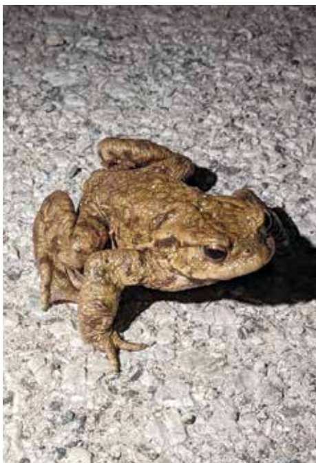
Navadna krastača ( Bufo bufo ) ob tveganim prečkanju ceste

V večini evropskih držav so varovanju dvoživk namenjeni številni ukrepi. V Sloveniji so vse vrste dvoživk zakonsko varovane in v zadnjih letih se zanje izvaja vse več varstvenih ukrepov. Eden pomembnejših projektov za varstvo dvoživk v Sloveniji je projekt LIFE AMPHICON – Ohranjanje dvoživk in obnova njihovih habitatov (LIFE 18NAT/SI/000711, 2019-2026). Cilj projekta je izboljšati stanje ohranjenosti dvoživk, ki jih varuje Direktiva o habitatih, v šestih izbranih območjih Natura 2000 v Sloveniji, na Danskem in v Nemčiji. Projekt LIFE AMPHICON se v Sloveniji prvič celostno loteva reševanja tega vprašanja v štirih območjih Natura 2000 z obnovo mrestišč in kopenskih habitatov, z izboljšanjem njihove povezanosti ter z zmanjšanjem smrtnosti na cestah z gradnjo trajnih usmerjevalnih ograj in podhodov. S pomočjo dolgoletnih izkušenj ter znanja projektnih partnerjev iz Danske in Nemčije, v Sloveniji ter v Evropi prvič izvajamo krepitev majhne in izolirane populacije velikega pupka s podporno vzrejo. Vzpostavili smo tudi Informacijski center za varstvo dvoživk Slovenije (ICVDS), ki posreduje infor-