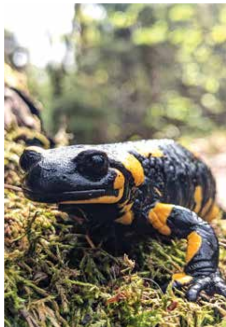
Navadni močerad ( Salamandra salamandra )

macije in promovira primere dobre prakse za varstvo dvoživk in njihovih habitatov ter selitvenih poti. Glavni cilj Informacijskega centra je spodbujati izvajanje ukrepov za dvoživke in v nacionalno mrežo povezati različne organizacije, društva, prostovoljce in posameznike, ki prispevajo k varstvu dvoživk v Sloveniji. Občina Zagorje ob Savi je v letu 2023 že obnovila manjše mokrišče Mlaka na Izlakah. Letos je na drugi strani občine in na površini v lasti Sklada kmetijskih zemljišč in gozdov na Orleku zaživela popolnoma nova mlaka, ki je dvoživkam skrajšala pot do stoječe vode, predvsem pa na tej poti ne bodo več prečkale ceste. Na lokalni cesti od Zagorja