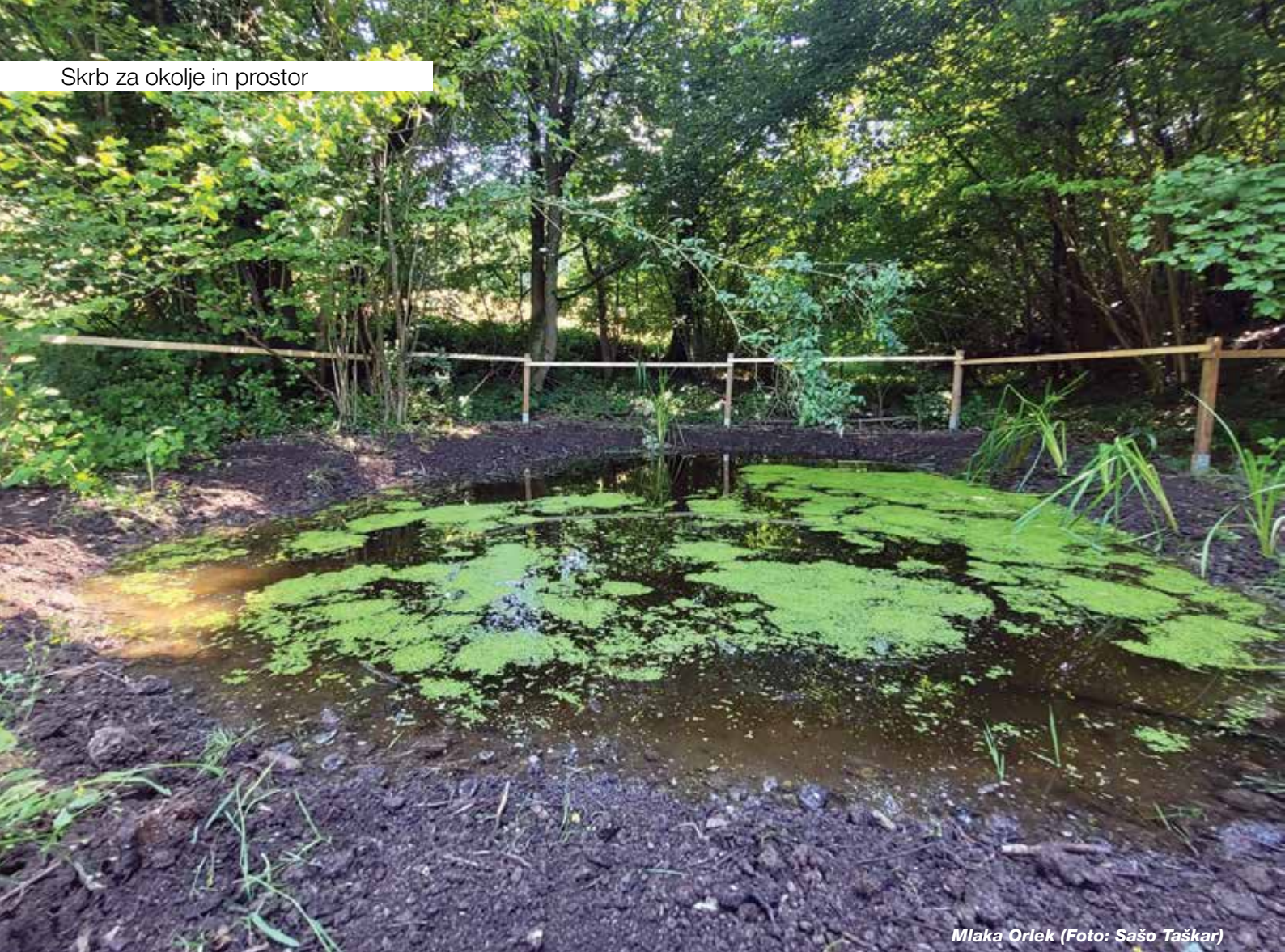
Mlaka Orlek