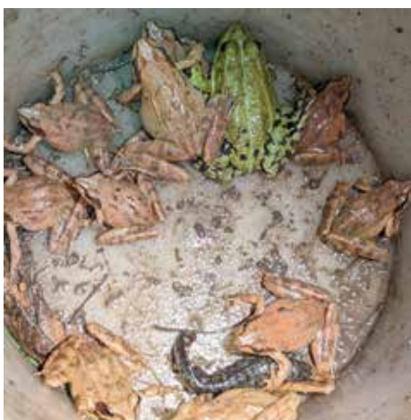
Akcija prenašanja dvoživk – rjave in zelene žabe ter veliki pupek

macije in promovira primere dobre prakse za varstvo dvoživk in njihovih habitatov ter selitvenih poti. Glavni cilj Informacijskega centra je spodbujati izvajanje ukrepov za dvoživke in v nacionalno mrežo povezati različne organizacije, društva, prostovoljce in posameznike, ki prispevajo k varstvu dvoživk v Sloveniji. Občina Zagorje ob Savi je v letu 2023 že obnovila manjše mokrišče Mlaka na Izlakah. Letos je na drugi strani občine in na površini v lasti Sklada kmetijskih zemljišč in gozdov na Orleku zaživela popolnoma nova mlaka, ki je dvoživkam skrajšala pot do stoječe vode, predvsem pa na tej poti ne bodo več prečkale ceste. Na lokalni cesti od Zagorja